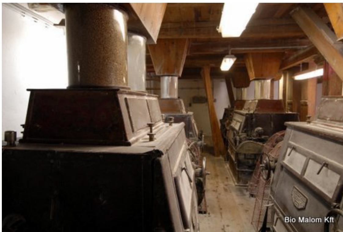
Egy 150 éves, alkalmazott művészeti értékkel bíró malom.